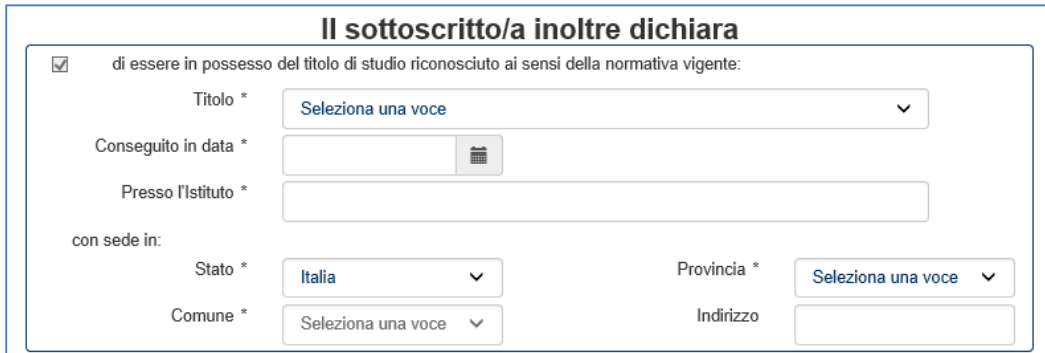
Figura 11 - Dichiarazioni: Quadro 1