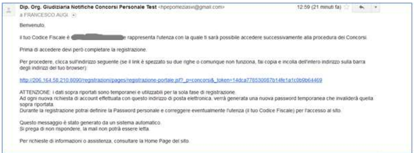
Figura 2 - E-mail di registrazione

Il sistema invia nella casella di posta personale, indicata nella Richiesta di Registrazione, una e-mail contenente tutte le informazioni necessarie al completamento della procedura di registrazione. Un esempio è riportato nella figura seguente: