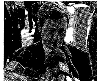
Il Guardasigilli Andrea Orlando