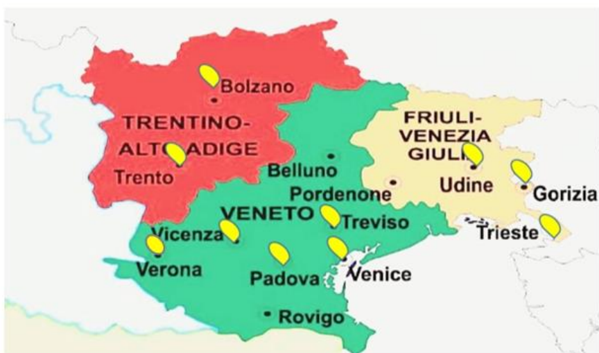
Figura 2: Competenza territoriale dell'UIEPE per il Veneto, il Friuli Venezia Giulia e le Province Autonome di Trento e Bolzano e articolazione territoriale degli Uffici Distrettuali e Locali.