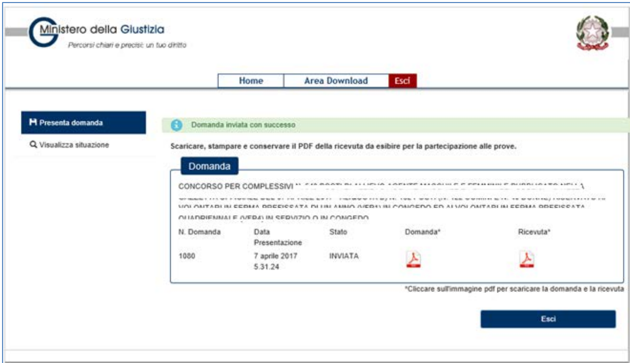
Figura 18 - Domanda inviata