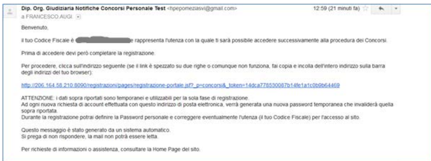
Figura 2 - E-mail di registrazione

Il sistema invia nella casella di posta personale, indicata nella Richiesta di Registrazione, una e-mail contenente tutte le informazioni necessarie al completamento della procedura di registrazione. Un esempio è riportato nella figura seguente: