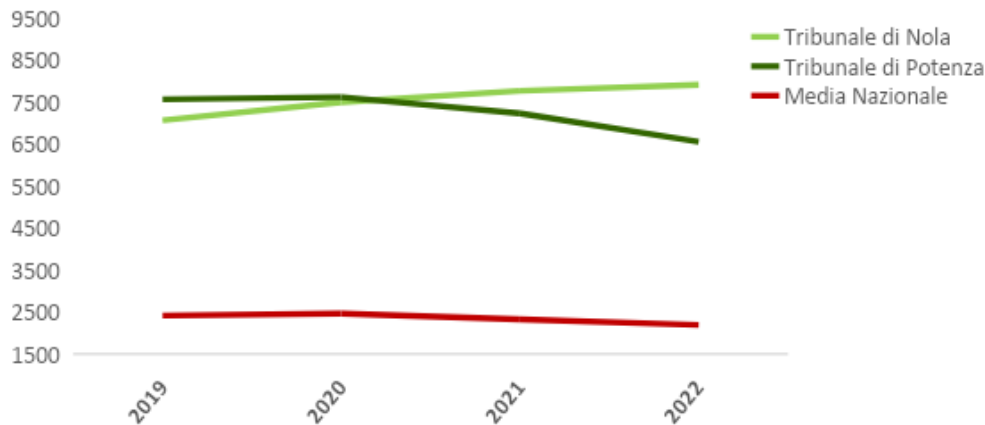
Figura 4 – Serie storica per l’andamento dell’arretrato dal 2019 al 2022, per i Tribunali di Nola e Potenza rispetto all’andamento della media nazionale. La fascia rossa evidenzia il periodo della pandemia. Elaborazione sui dati webstat.giustizia.it .

Come prevedibile, anche la quantità dei casi arretrati nei due tribunali è nettamente superiore alla media nazionale (Figura 4).