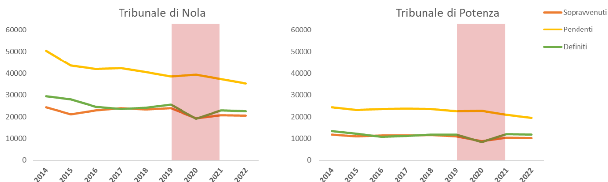
Figura 1 – Serie storica per l’andamento del contenzioso - sopravvenuti, definiti, pendenti - dal 2014 al 2022, per i Tribunali di Nola e Potenza. La fascia rossa evidenzia il periodo della pandemia.

In Figura 1 è possibile osservare l’andamento quantitativo del contenzioso dei Tribunali di Nola e di Potenza dal 2014 al 2022.